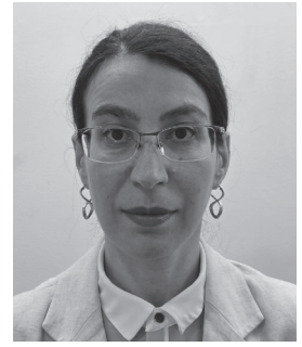
駐日ジョージア大使館 公使参事官 ルスダン・レキシシュヴィリ