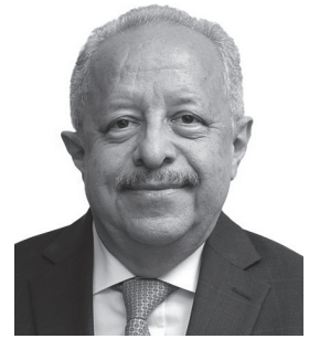
グアテマラ外務大臣