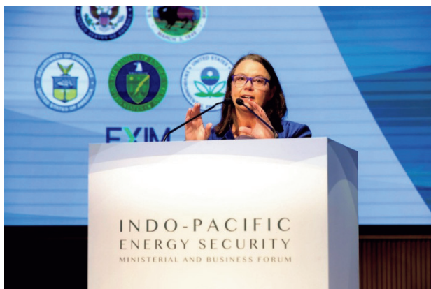
本年のインド太平洋エネルギー安全保障閣僚・ビジネスフォーラム (IPEM) に出席したオーストラリアのマデレン・キング資源・豪北部大臣