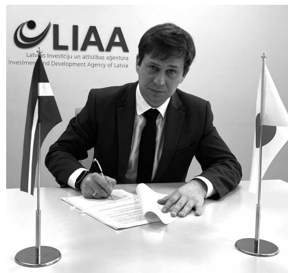
ラトビア投資開発庁 カスバルス・ロージェカルス長官