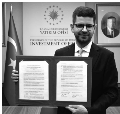
トルコ共和国大統領府投資局 ブラク・ダールオール総裁