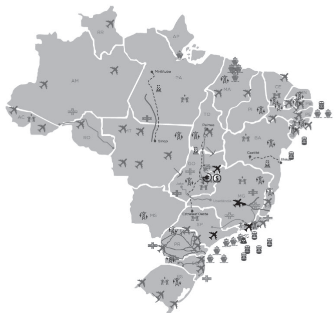
現在進行中のPPIプロジェクト ( https://www.ppi.gov.br/ppi-english )

日伯双方の政府・企業にとって有利なプロジェクトが見つけられるに違いないと確信しているため、日本の投資家の皆様には、ブラジルのインフラ部門におけるビジネス好機を見逃さず、注意深く検討されることをお願いしたい。